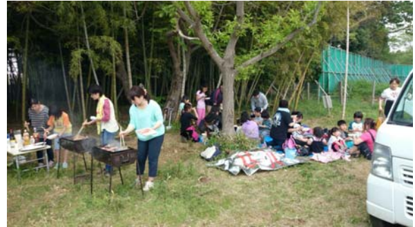
母子ホームの皆さん