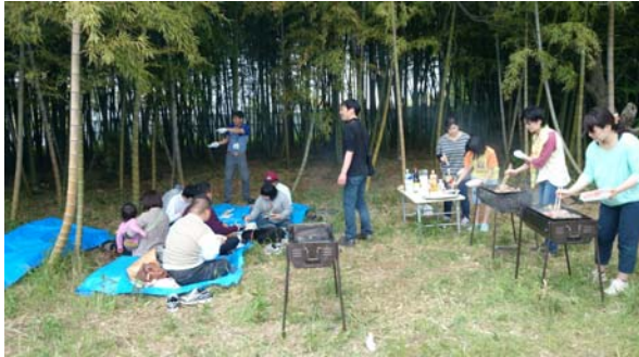
そよ風ひろばの皆さん