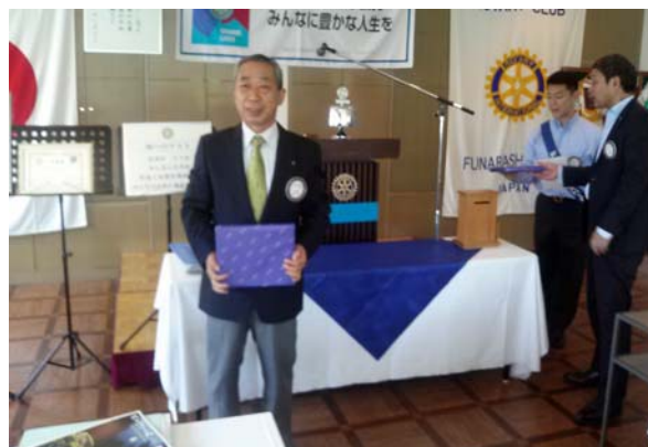
結婚記念日のスピーチ